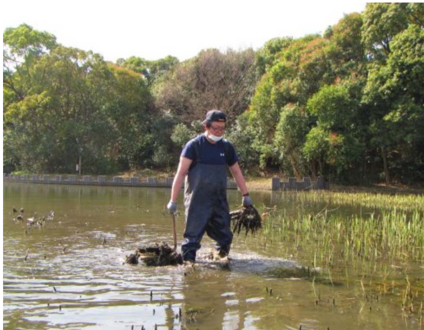
社員が湿地の除草作業